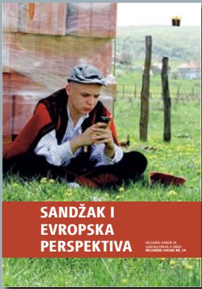
29. Sandžak i evropska perspektiva