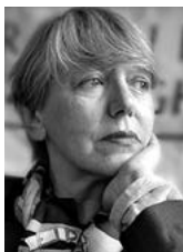
PIŠE: SONJA BISERKO