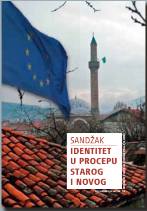
28. Sandžak: Identitet u procepu starog i novog