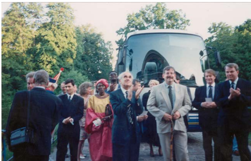
Adil Zulfikarpašić s učesnicima kongresa Liberalne internacionale u Berlinu