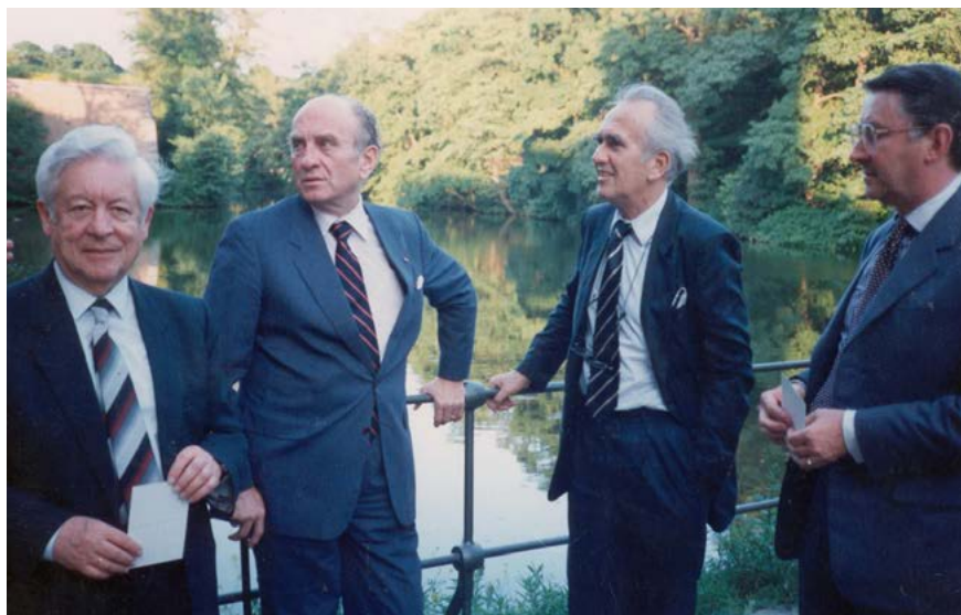
Adil Zulfikarpašić i grof Otto Lambsdorff na kongresu Liberalne internacionale