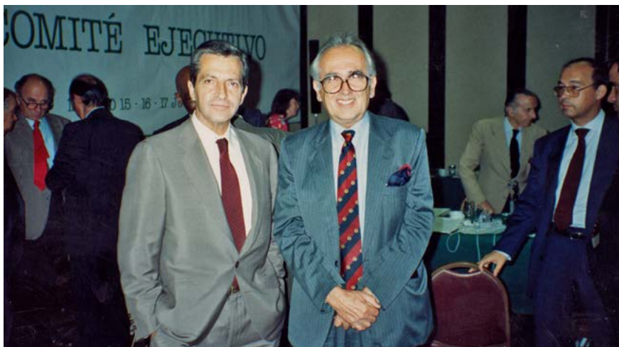
Adolfo Suárez i Adil Zulfikarpašić na kongresu Liberalne internacionale