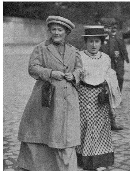
Klara Cetkin i Rosa Luksemburg, 1910.

Iako je Klara Cetkin predložila formalno ustanovljenje Dana žene tokom Socijalističke internacionale u Kopenhagenu 1910. godine, tim datumom se inicijalno nisu promovisali samo pravo na rad i ravnopravni uslovi rada, već i pravo glasa i, uopšte uzev, pravo žena na vidljivost u javnoj sferi. Ovo dobija posebno istaknuto mesto tokom Prvog svetskog rata, kada je protest žena protiv rata postao neodvojiv od tih zahteva. Međutim, temeljna veza između Dana žena i socijalizma uspostavljena je 1917. godine, budući da je štrajk žena za hleb i mir doveo do abdikacije ruskog cara. Zaslugama Aleksandre Kolontaj, neposredno po svršetku Oktobarske revolucije 8. mart zvanično postaje praznik u Sovjetskom Savezu.