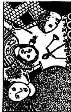
Proglas feminističke grupe Žene i društvo SOS-a, 1993.