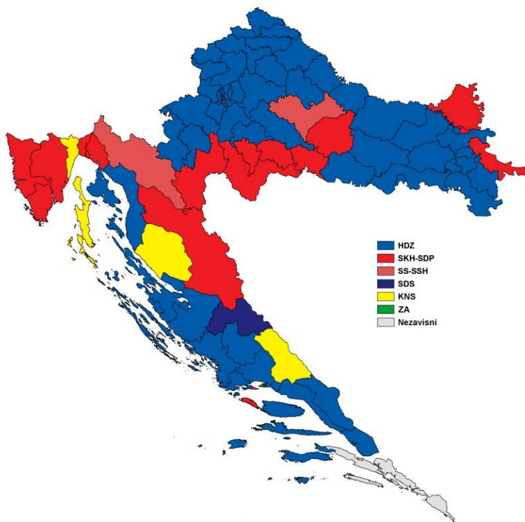
Мапа 1. Резултати првих вишестраначких избора у Хрватској 1990. године по изборним јединицама

били наклоњени Савезу комуниста, а који су чинили значајан корпус гласова који је ова странка освојила на првим изборима 1990. године – што је илустровано изборним успехом СДП у деловима земље са израженим присуством српске популације (видети: Мапа 1).