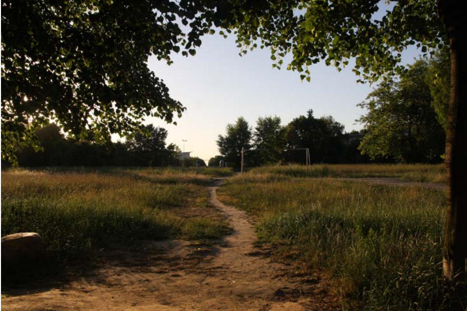
Илустрација 2. Недовршени парк, Osiedle Orła Białego, Познањ, мај 2018; снимила: Сара Николић