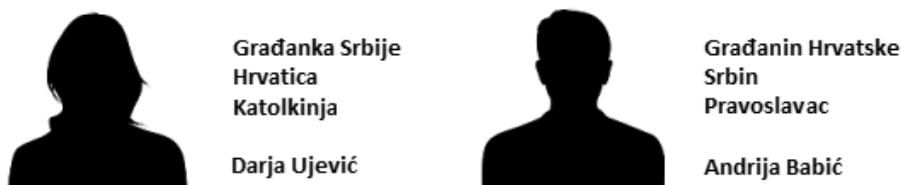
Slika 1. Primeri stimulusa u zadatku sortiranja karata – ženska i muška silueta sa ukrštenim grupnim pripadnostima

.91) (van Dommelen et al., 2015). Zadatak se sastojao od 24 siluete i opisa fiktivnih osoba, koje sa ispitanicima imaju sva tri, dva, jedan ili nijedan zajednički socijalni identitet, odn. grupnu pripadnost (Slika 1). U svakoj od kombinacija (3, 2, 1 ili 0) bilo je po 6 fiktivnih osoba. Polovina je bila ženskog, a polovina muškog pola. Ispitanicima je zadatak bio da svaku od prikazanih osoba svrstaju u jednu od dve grupe: MI ili ONI. Ukupan broj osoba svrstanih u grupu MI čini meru inkluzivnosti socijalnog identiteta.