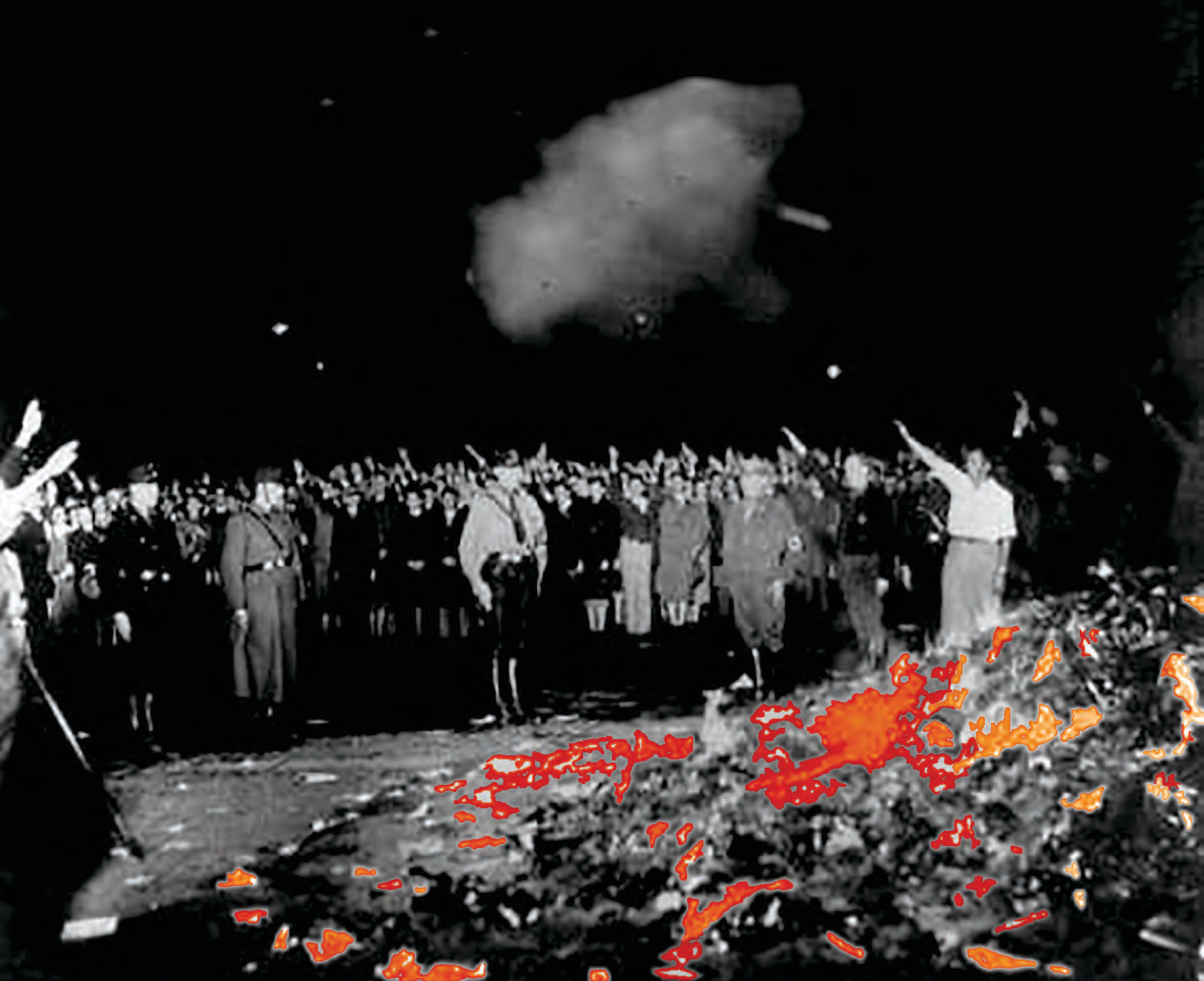
Opernplac, Berlin, Nemačka, 10. maj 1933.

„OVO JE BILA PREDIGRA SAMO, TAMO GDE SPALJUJU KNJIGE NA KRAJU ĆE SPALJIVATI I LJUDE” Hajnrih Hajne