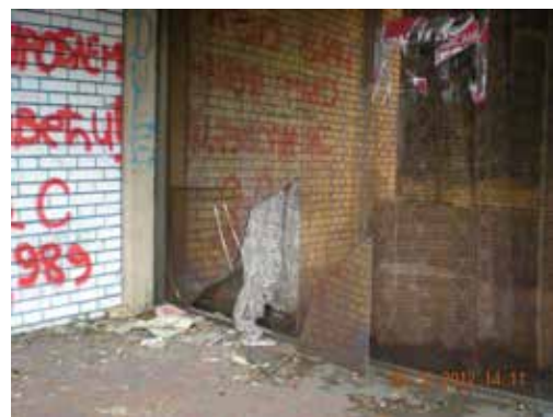
Slike 17, 18 i 19