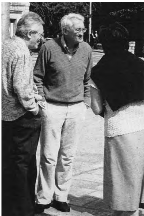
Gajo Petrović i Jürgen Habermas