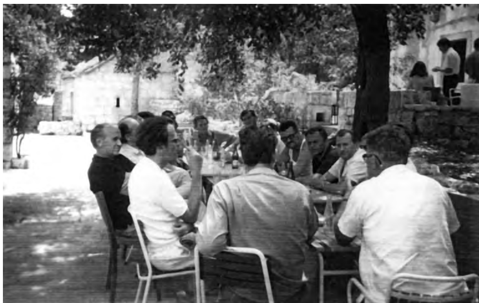
Sastanak Upravnog odbora Korčulanske ljetne škole