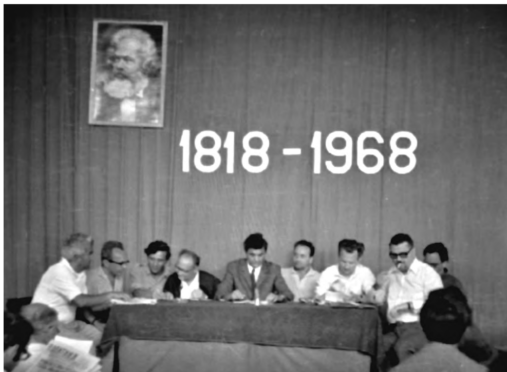
Predsedavajući sesije 1968.