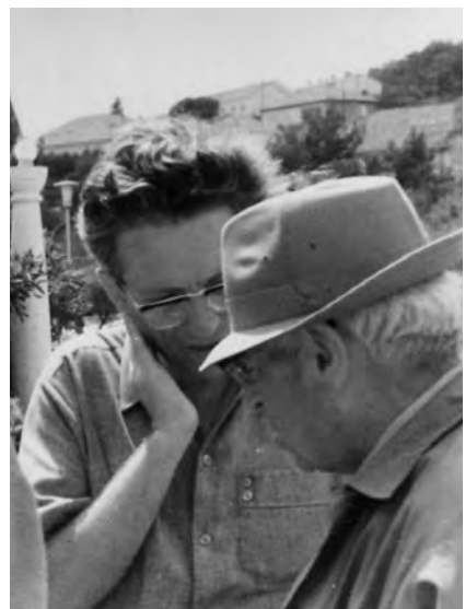
Gajo Petrović i Ernst Bloh